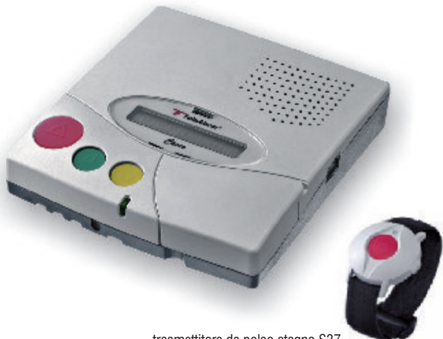
trasmettitore da polso stagno S37

Il secondo pulsante permette di cancellare manualmente un allarme, mentre il terzo può essere programmato come "segnalazione di presenza" o come pulsante di servizio. Il pulsante di servizio può essere utilizzato per accedere a prestazioni speciali aggiuntive utili, per esempio, in case di ricovero o assistenza domiciliare. Caveo® può essere utilizzato come unità a uno, due o tre pulsanti a seconda della situazione e della configurazione.