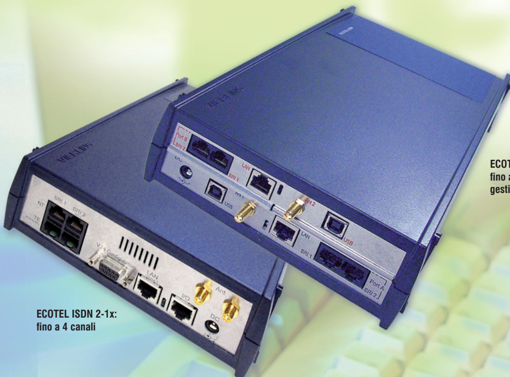
ECOTEL ISDN 2-1x: fino a 4 canali