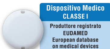
Design semplice e rassicurante, studiato per la demenza