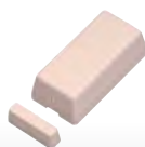
Rilevatore di contatto